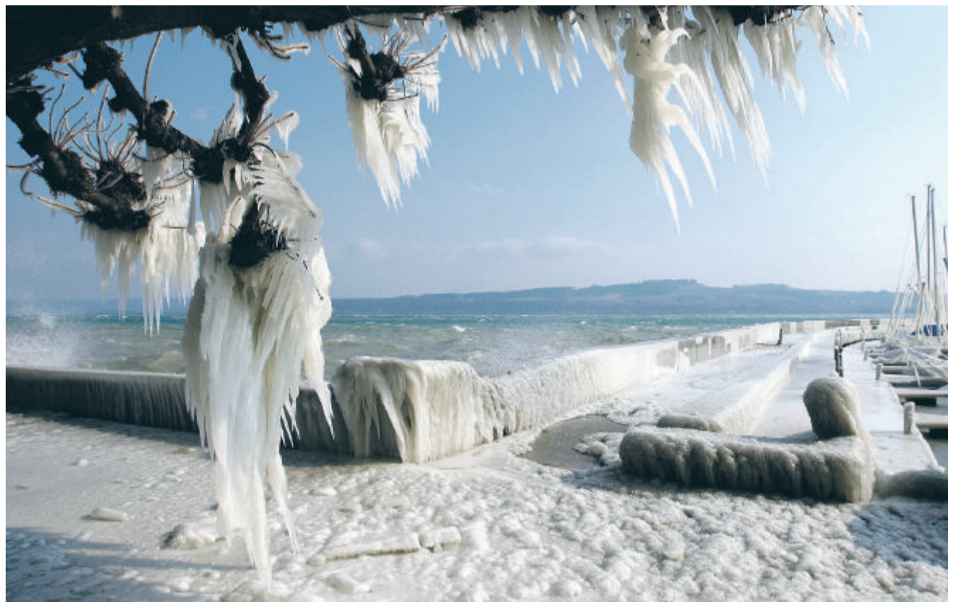
Wetterlagen 2010: Wärmegewitter über dem Uetliberg am 12. August (oben), Eiszeit bei Grandson VD am 9. März (unten).

Grüne Gentechnik Warum wir uns das Gut-böse-Schema in der Agrarforschung immer weniger leisten können. Von Philipp Aerni